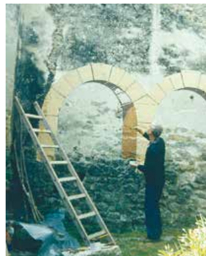
La maison de Bourdeaux.

Vacances et week-end étaient consacrés à la restauration de la maison car elle était vraiment en bien mauvais état! Ces travaux ont duré deux ans et ma mère travaillait autant que mon père! Ne pouvant vivre dans la maison au milieu du chantier, nous logions au