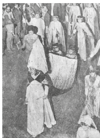
Défilé à pied.